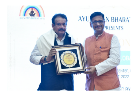
Prof. S.P. Baghel, Hon'ble Minister of State for Health and Family Welfare, Govt. of India

04- 05 August, 2022, India International Centre, New Delhi