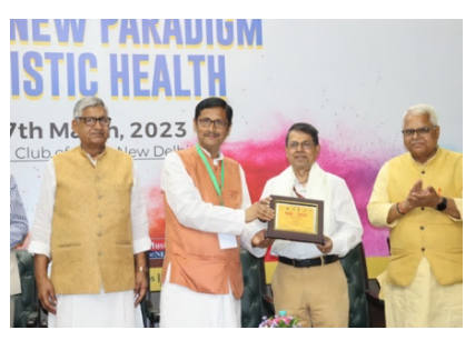
Shri Shantmanu, Additional Secretary of Food Consumer Affairs, Food & Public Distribution, Goyt. of India