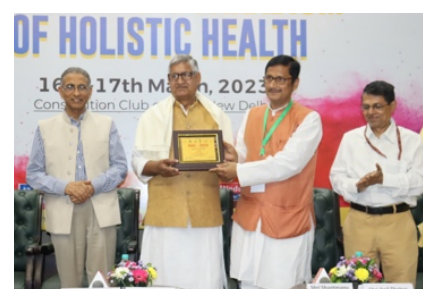
Shri Ram Chandra Jandra, Hon'ble MP, Rajya Sabha

16-17 March, 2023, Constitution Club of India, New Delhi