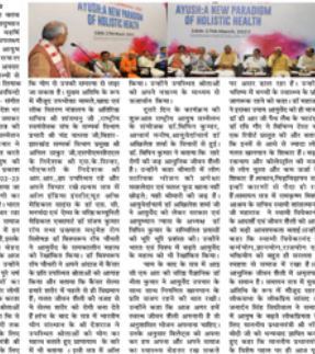
दस्तक प्रभात हिन्दी दैनिक कांस्टीट्यूशन क्लब ऑफ झेंडेवा के दो दिवसीय नेशनल आयुष कॉन्फ्रेन्स सफलतापूर्वक सम्पन